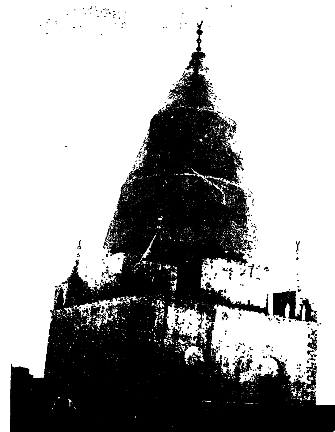
القبة الجديلة للشيخ عجيب بقرى