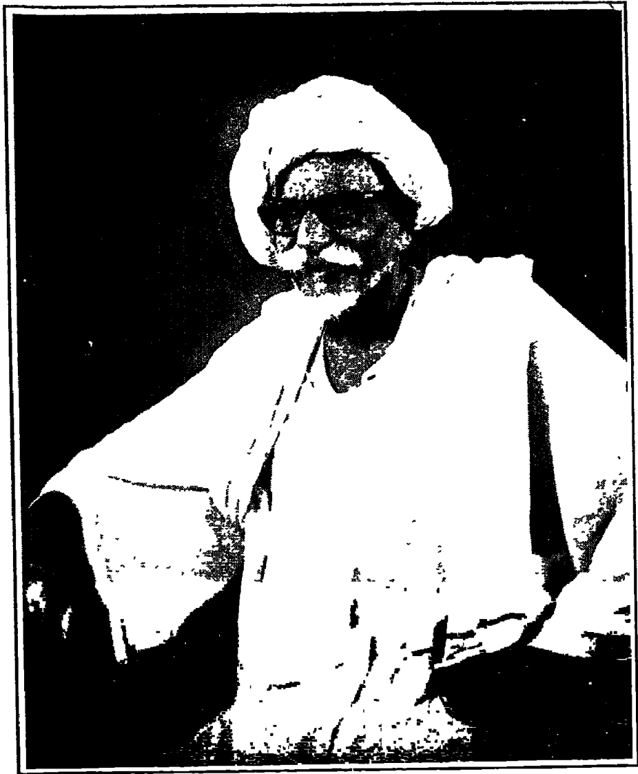
صورة لشيخ ممثل لنماذج المشايخ العلماء الذين نشروا الدعوة في السودان

وكان لا بد من أن يمتد الفتح العربي الإسلامي إلى جنوب مصر (الصعيد) ثم إلى بلاد النوبة والسودان وذلك لتأمين الدولة الإسلامية العربية التي أخضعت كل بلاد المصريين لسلطانها.