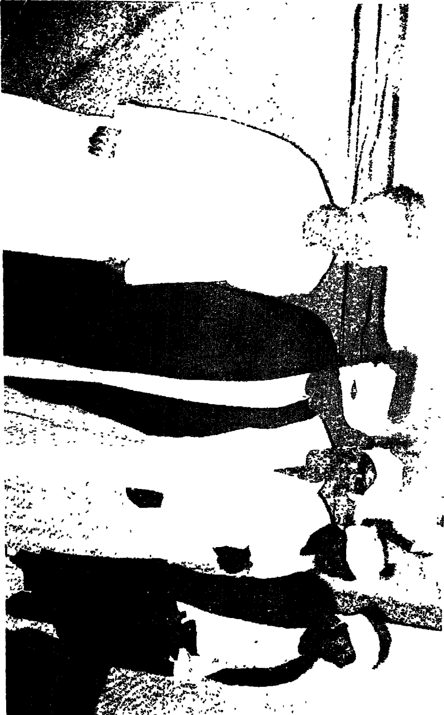
أحفاد الشيخ عجيب مع المؤلف داخل الضريح