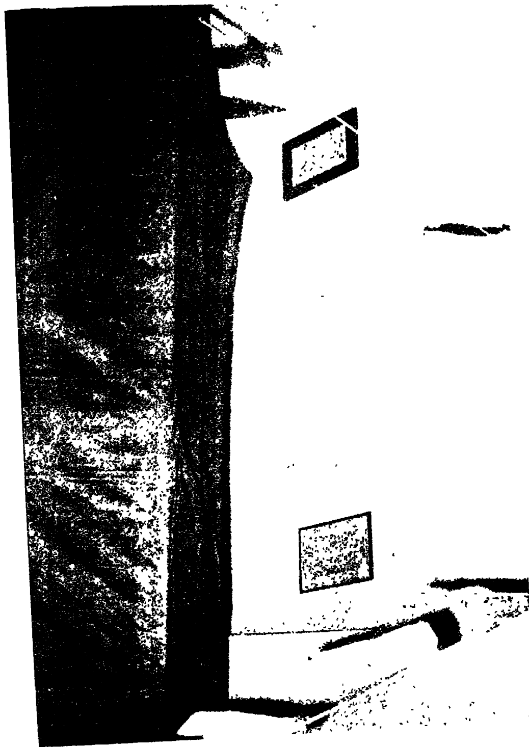
القبة القديمة لضريح الشيخ عجيب المانجلك بقرية قرّى